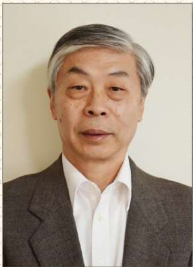
□ 作者：朱炎 拓殖大学政经学部教授

1957 年生于中国上海市。复旦大学经济系、日本一桥大学研究生院毕业。1990 年到富士总合研究所做经济研究工作，1996 年转至富士通总研，任经济研究所主席研究员。2009 年任拓殖大学政经学部教授至今。