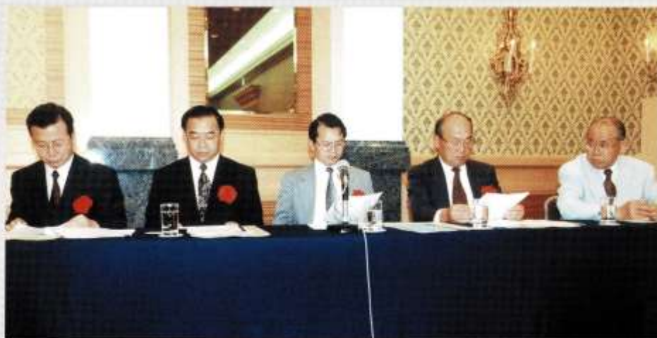
○貴賓：中國駐日公使程水華，商務參贊呂克儉，總領事羅田廣，留日華僑聯合總會副會長金嶽，日本國際貿易促進協會理事長中田慶雄。