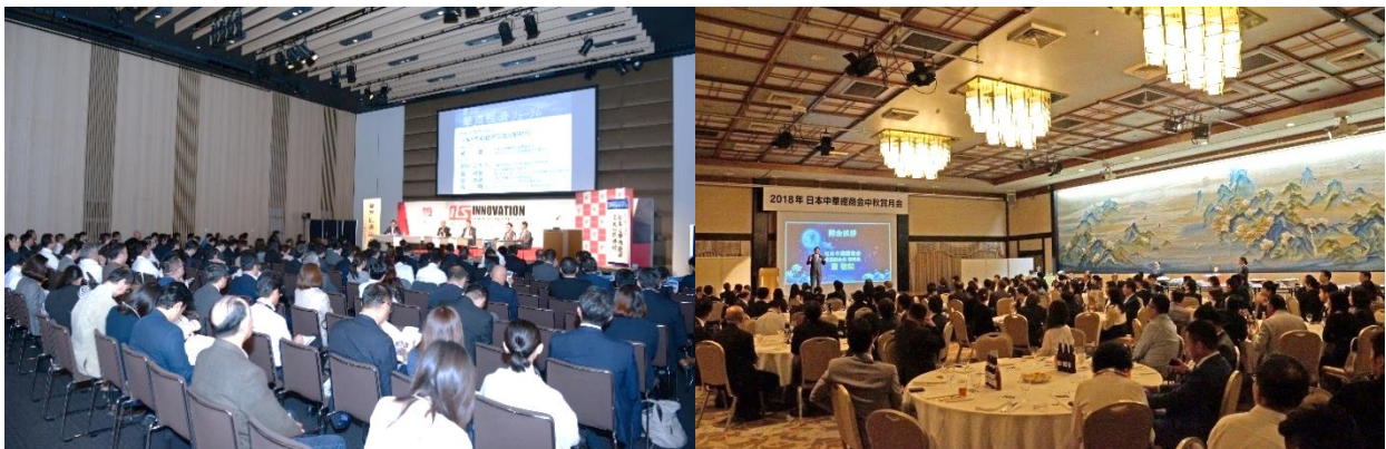
2018 年華商経済フォーラムの様子（左側）2019 年賞月会の様子（右側）

コロナの関係により、『華商経済フォーラム』は 4 年ぶり、『賞月会』は 3 年ぶりの開催であり、中国大使及び日本政財界の要人もお招きして盛大に開催する予定です。会員の皆様のご参加を心待ちにしております。