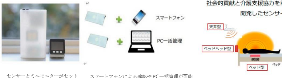
センサーとミニモニターがセット スマートフォンによる確認やPC一括管理が可能

高齢の日常を、わずらわしい機材を身に着けることなく、やさしく見守る非接触型バイタルセンサーが、離床・着床・脈拍・呼吸等、を自動的に感知して、目的に応じて、介護者の方々に、お知らせいたします。