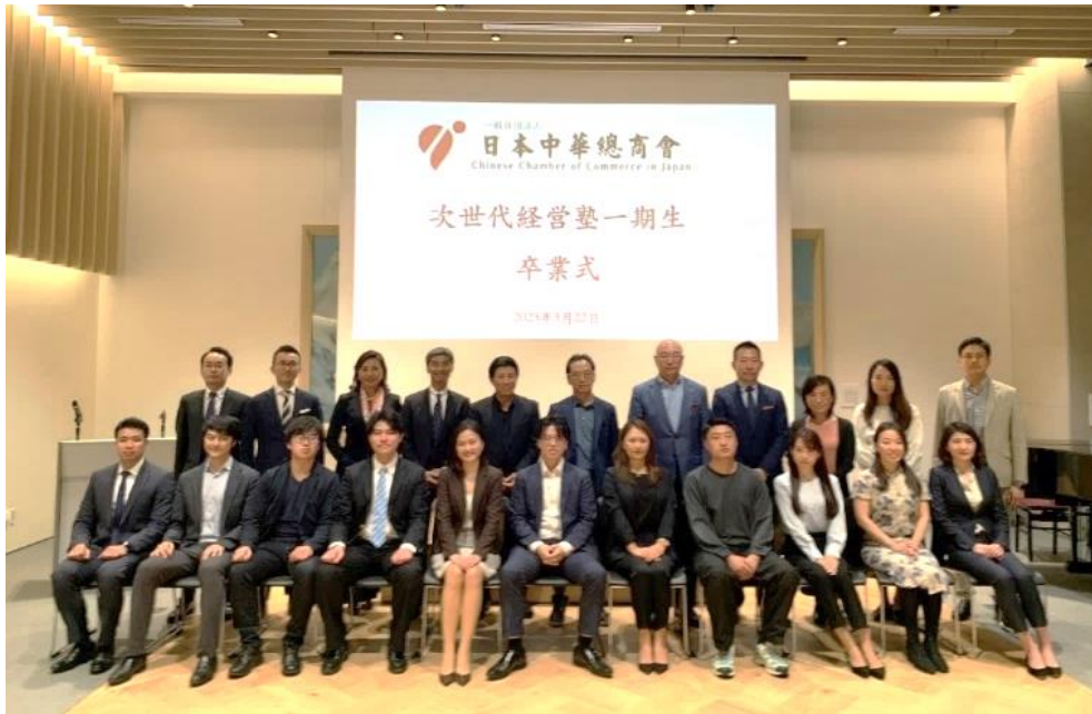
経営塾一期生卒業記念写真