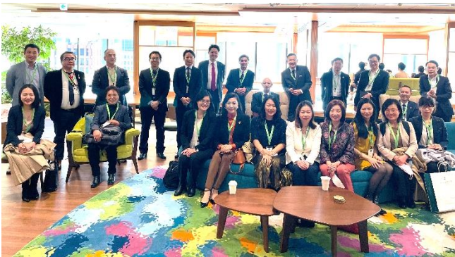
集合写真 ohana フロアにて

質疑応答の時間では、今後の世界情勢を踏まえたビジネス展開についての質問や、今後のビジネス共創の可能性にまで質問が及び、今回の企業視察会が、参加者の企業運営に多くの示唆を与えた時間になったといえましょう。