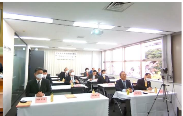
日本中華總商会事務局の様子