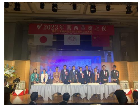
2023年11月関西華商之夜 大阪