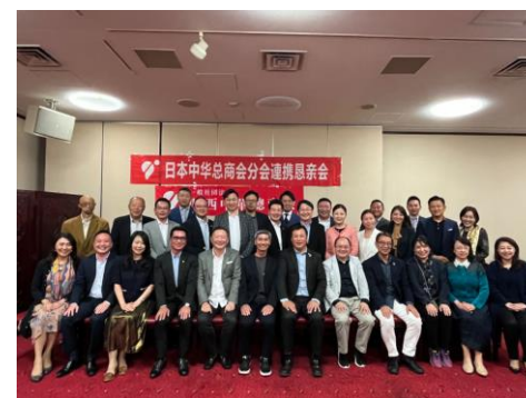
2023年10月分会連携懇親会 神戸