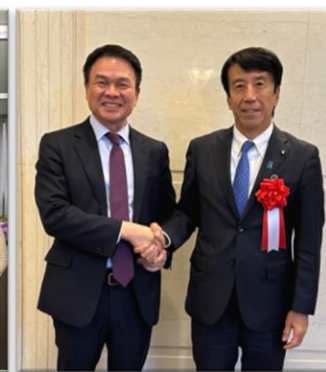
2023.12 ご就任直後の 齋藤健経済産業大臣と