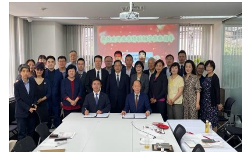
北京市侨联领导访问CCCJ