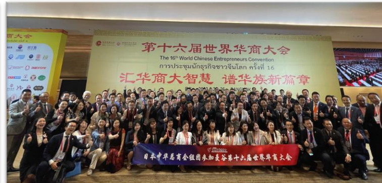
2023.06 タイでの世界華商大会参加