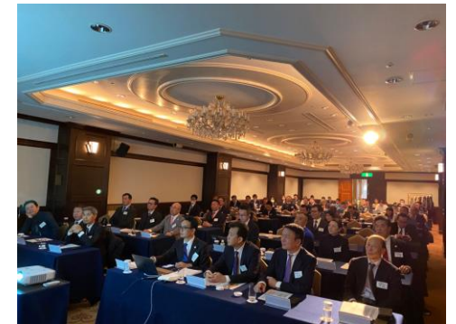
2024年1月定時社員総会 帝国ホテル