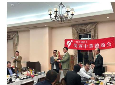
2023年10月分会ゴルフ懇親会 大阪