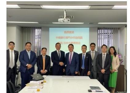
中国银行澳门分行领导访问CCCJ