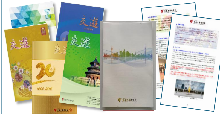
パンフレットなど制作物