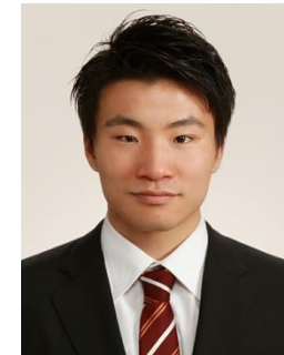
留福 運営委員 損害保険ジャパン株式会社

会員交流委員会の活動についてもっと知りたい方は各部会長、事務局、委員長までご連絡ください。