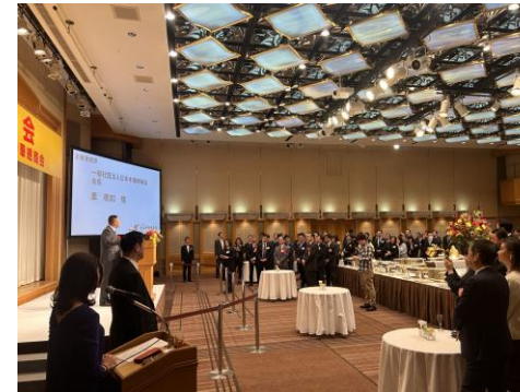
2024年1月迎春会 帝国ホテル