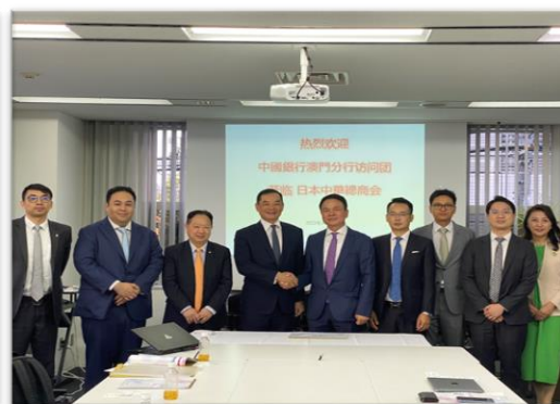
2023.10 中国銀行澳門支店来訪