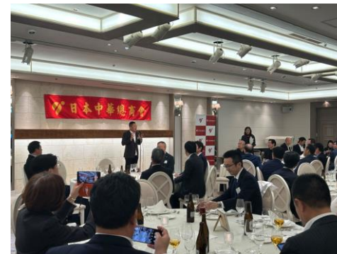
2023年12月役員懇親会 椿山荘