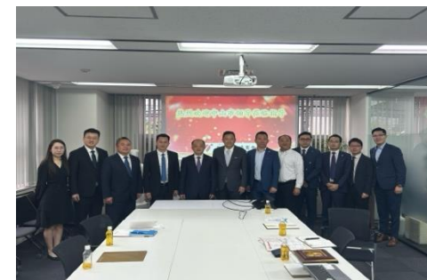
广东省中山市领导访问CCCJ