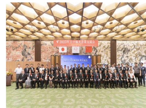
2023年日中観光企業交流会 大阪