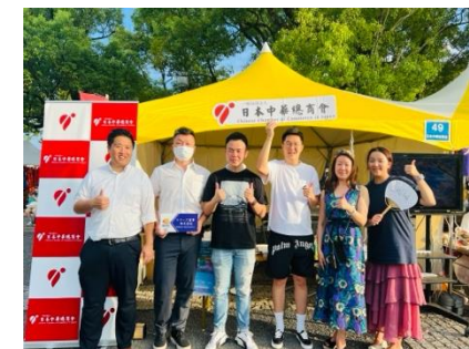
CCCJ 出展 东京中国节活动