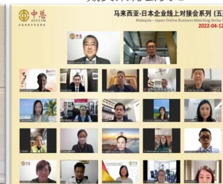
マレーシア中總との定期会議