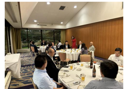
2023年9月 オフサイドMTG 軽井沢