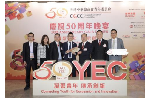
(香港中總青年委員会50周年)