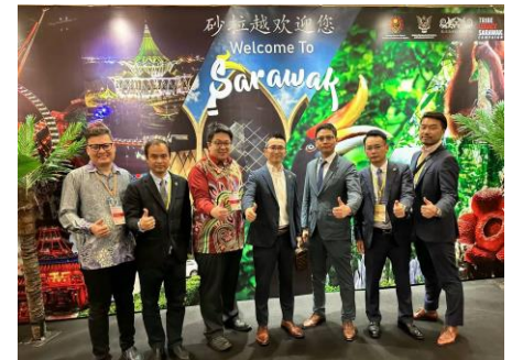
(マレーシアクチン中總130周年)