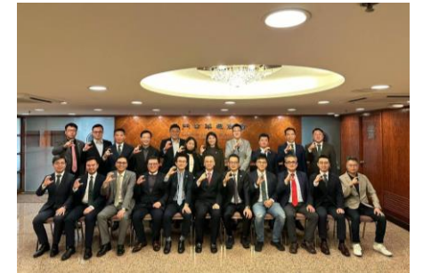
(マカオ中總表敬訪問)