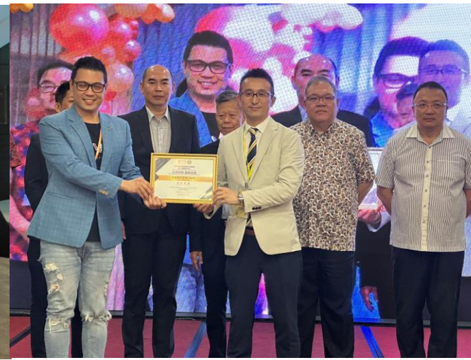
マレーシア中華總商會 2023年第12屆青商大會