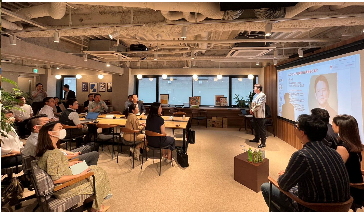
7月越境ECビジネスサロン