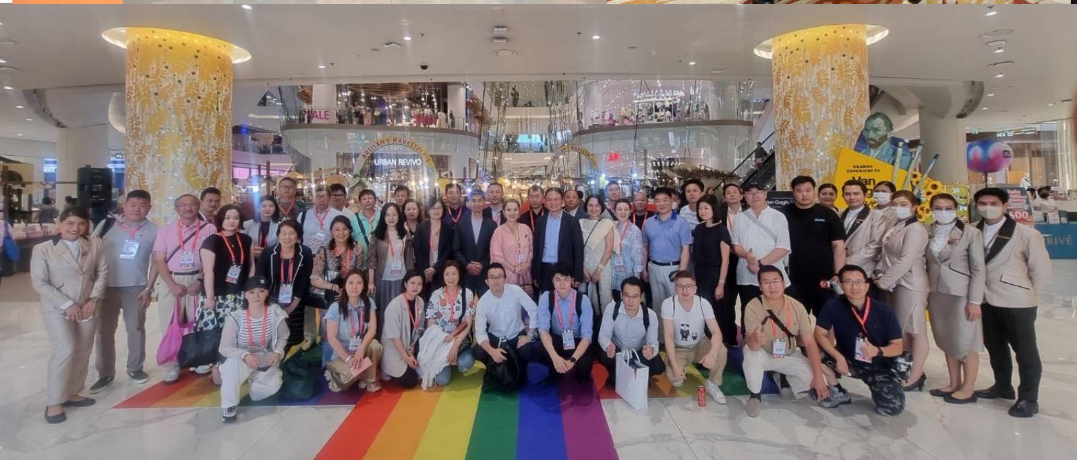
第16回世界華商大会（タイ）