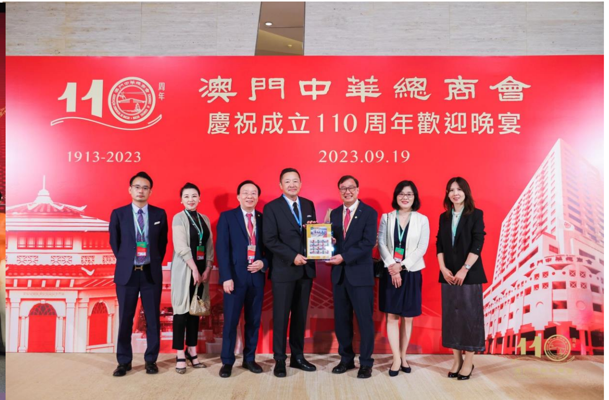
マカオ中華總商会110週年記念パーティー