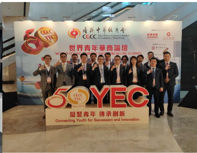
世界青年華商論壇 暨 香港青年委員會50週年慶祝晚宴