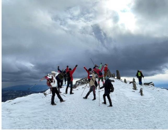
2月 美ヶ原へ冬登山