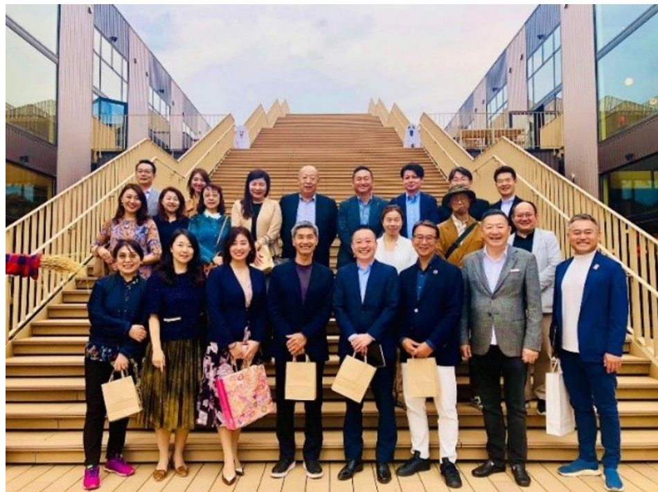
10月パソナ淡路島視察