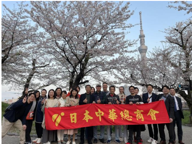
4月 夜桜を楽しむ会