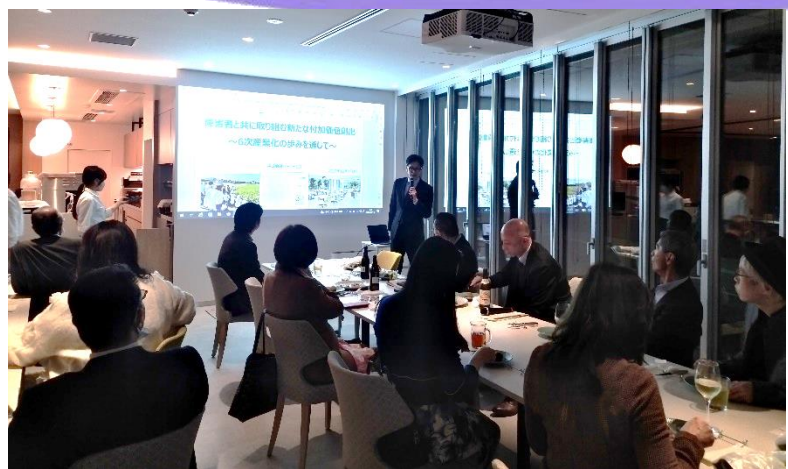
ビジネス交流会の様子 テーマ「食品」