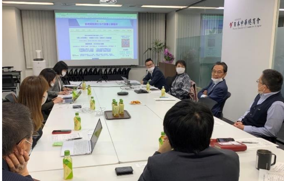
ビジネスサロンの様子