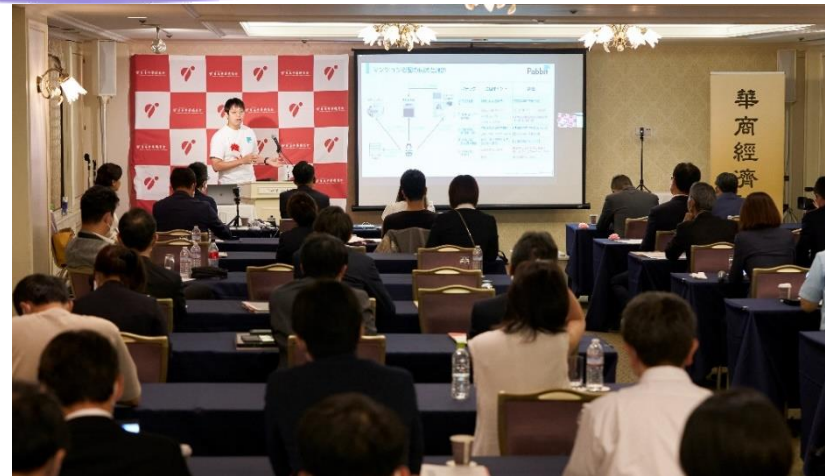
cccjビジネスコンテスト決勝戦2022 会場の様子