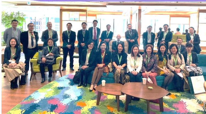
企業視察 株式会社セールスフォース・ジャパン