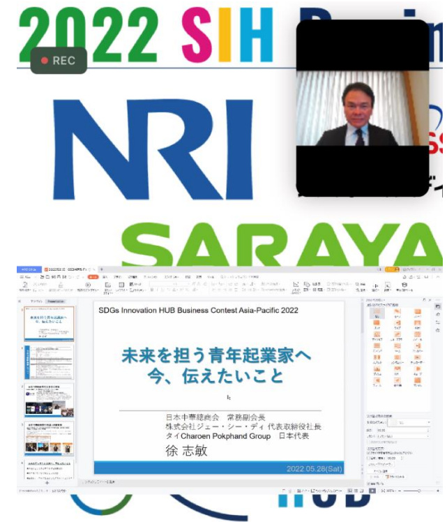
右：実際のオンライン配信画面