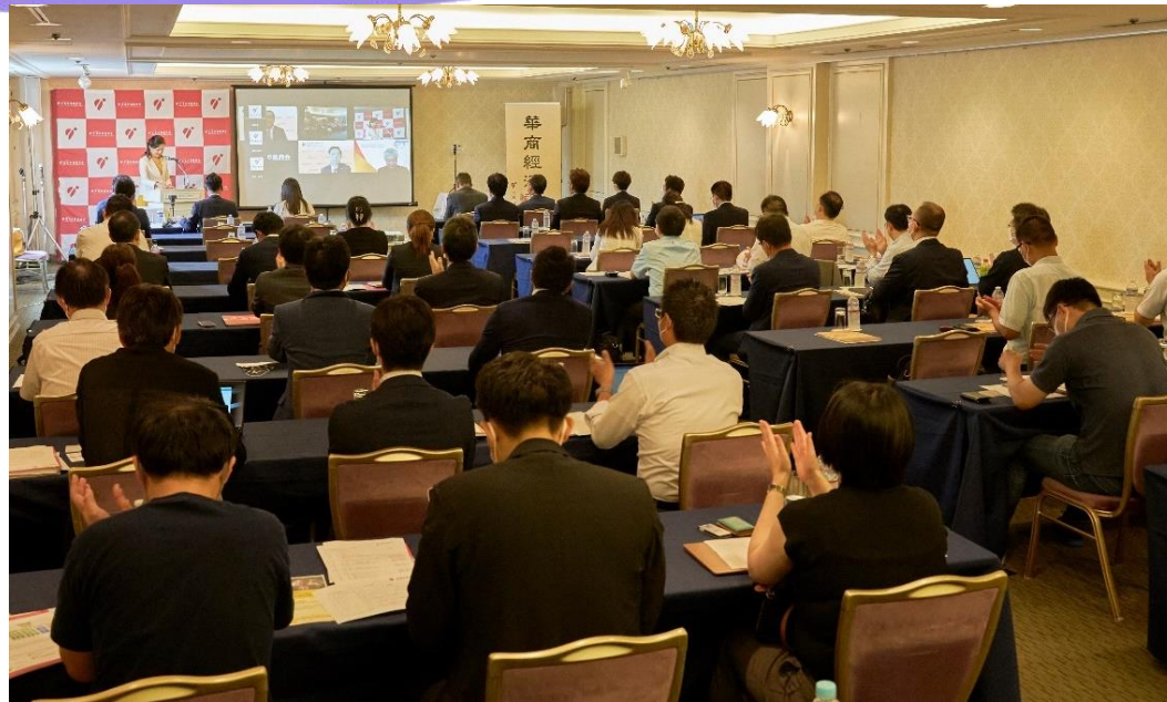
第4回『華商経済フォーラム』会場の様子