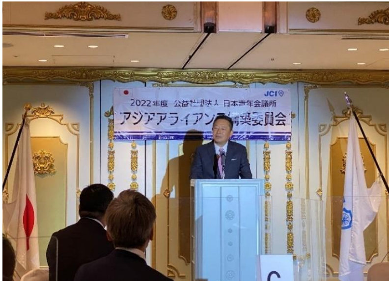
冒頭挨拶を行った蕭会長（左側）