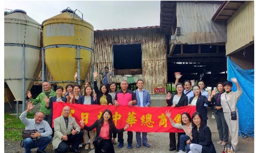
企業視察&レクリエーション、コラボイベント 漢方和牛・宮城県視察ミッション