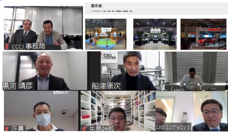
オンラインでの例会の様子