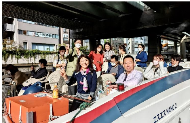
レクリエーションの様子 『五感で楽しむ東京都心の初秋』