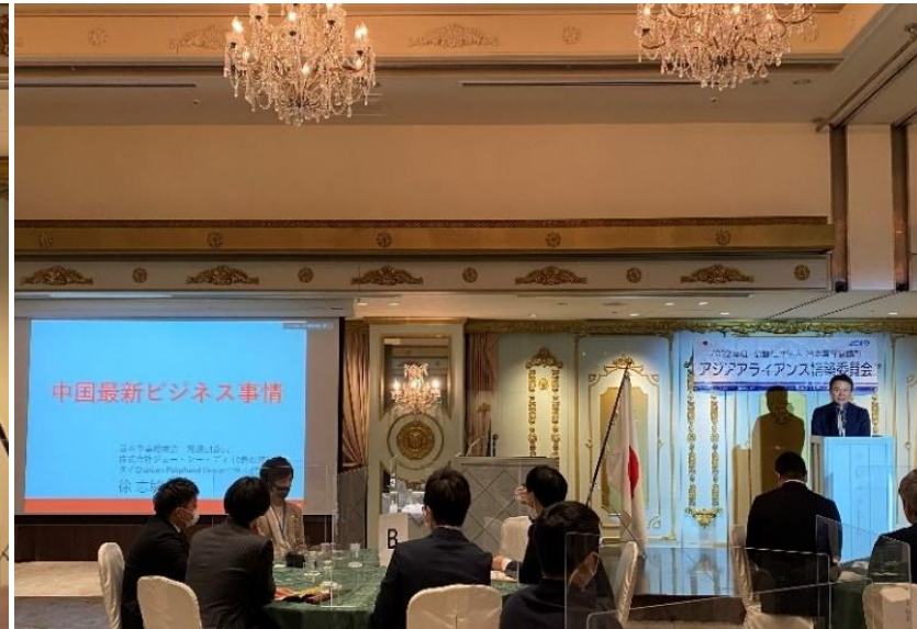
第2部で発表した徐常務副会長（右側）