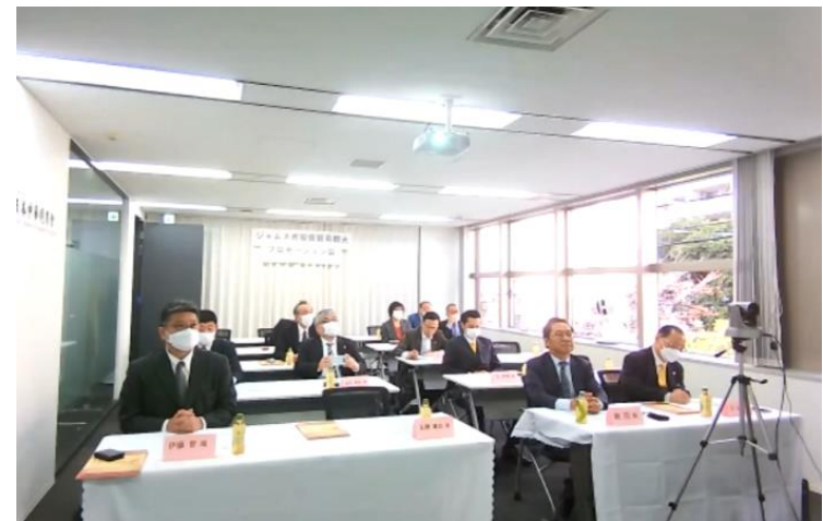
日本中華總商會事務局の様子