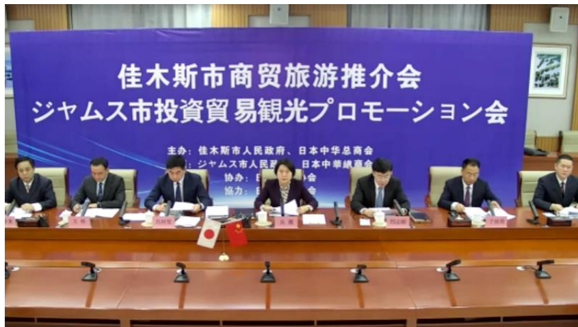
11月22日 ジャムス市側会場の様子