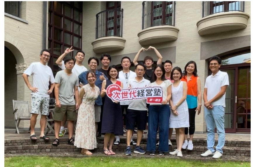
夏合宿での集合写真