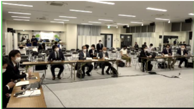
左：メイン会場の様子

SDGs Innovation HUB Business Contest Asia-Pacific 2022