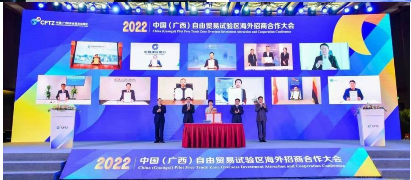
5月27日 広西自由貿易試験区 広西海外招商合作大会参加 提携覚書締結