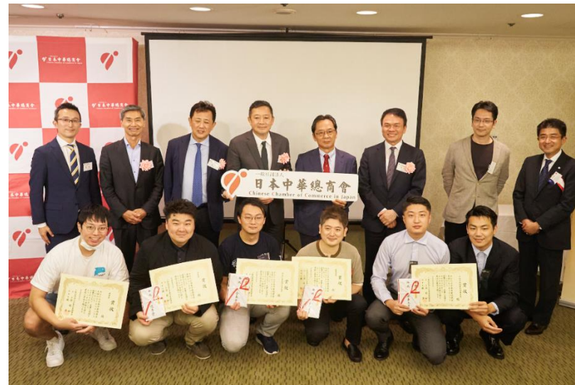
審査員と登壇者の集合写真