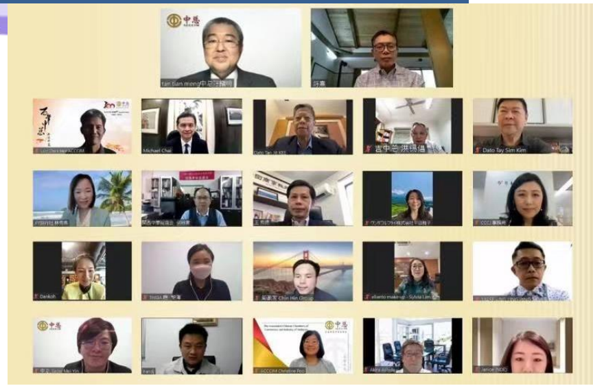
マレーシア中華總商會との定期交流会の集合写真