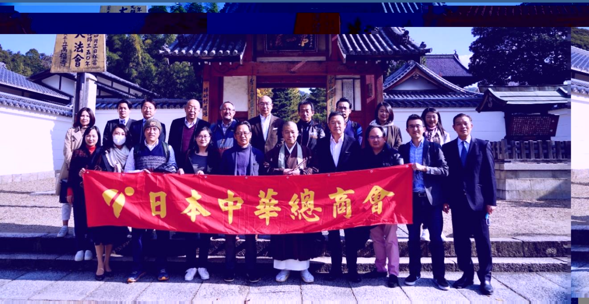
万福寺参拝時集合写真