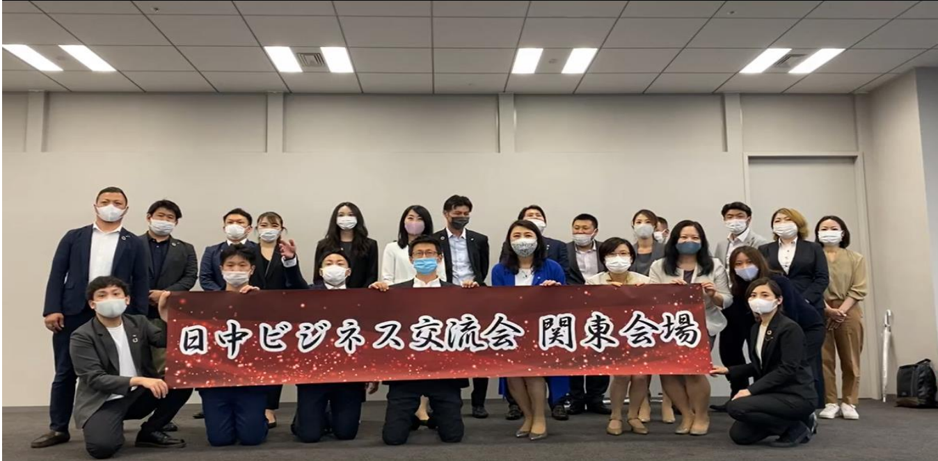
4月と7月の交流会の様子