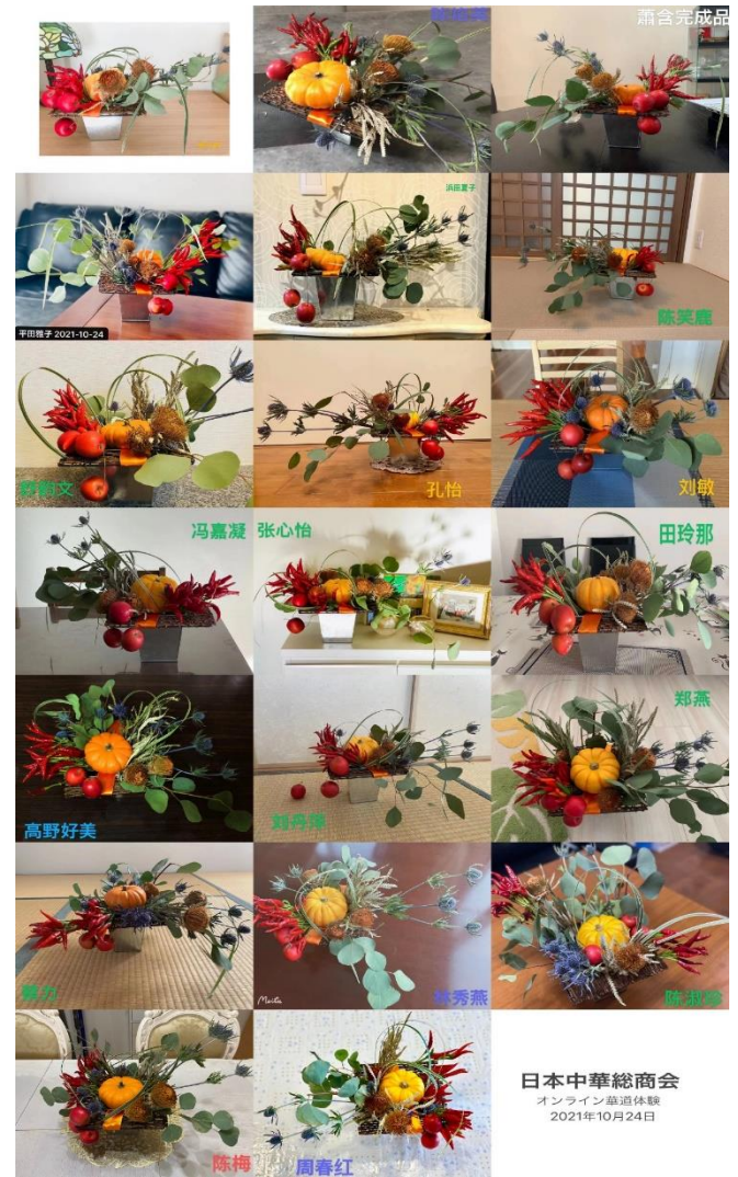
日本中華總商會 オンライン華道体験 2021年10月24日