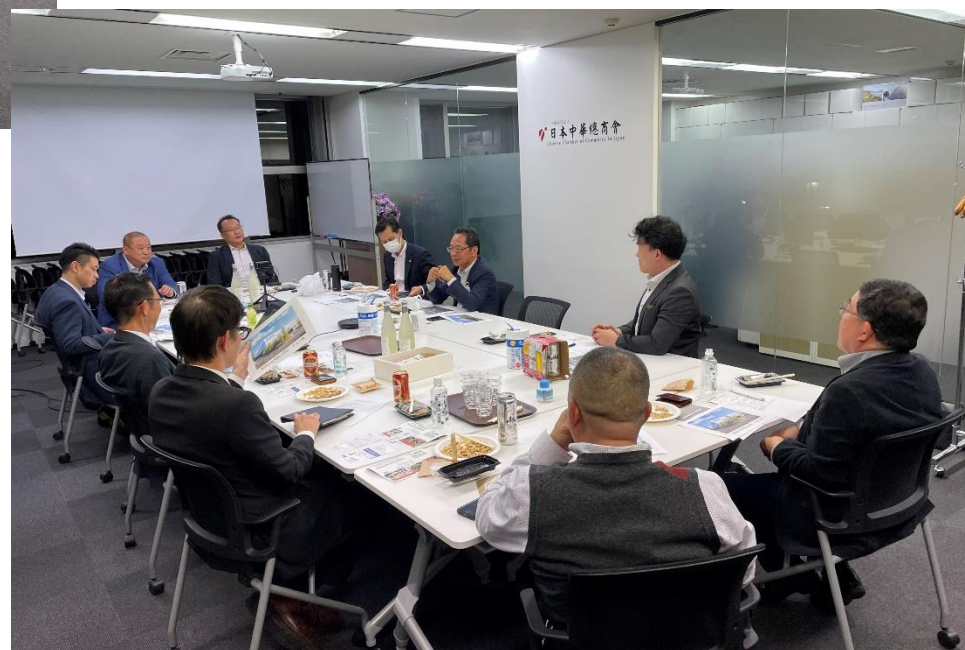
ビジネスサロン2回目