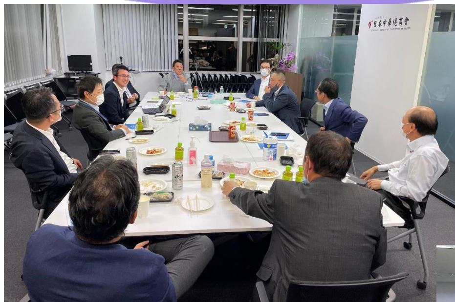
ビジネスサロン1回目