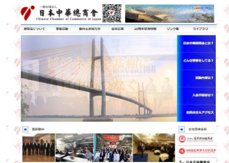
<ホームページをリニューアル>