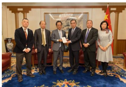
<孔中国大使にコロナ支援金を贈呈>