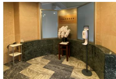
<コロナ対策をしたエントランス> 7