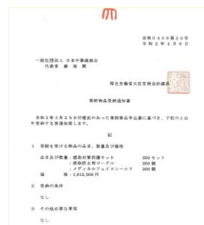
<厚生労働省より 寄付物資受納書>