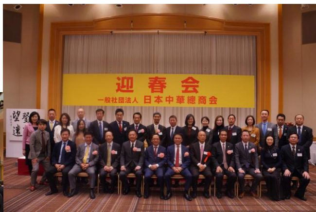
<コロナ拡大前で実施ができた唯一の大型イベント“迎春会”>