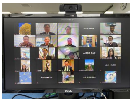
<運営委員会会議はオンラインで実施> 5