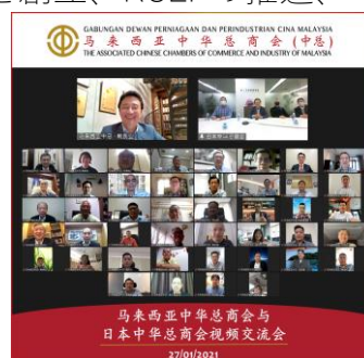
<左：韓国-世界華商周 右：マレーシア中華總商會とのオンライン交流会>