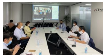
<執行理事会の様子>