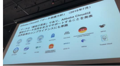
会員企業のプレゼンテーション