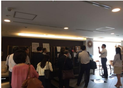
東京健康クリニック訪問時の写真