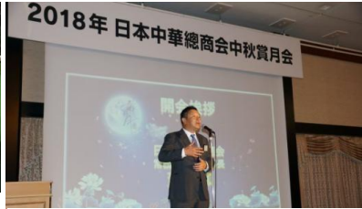
蕭理事長のご挨拶