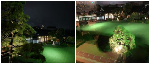
賞月會的樣子和會場