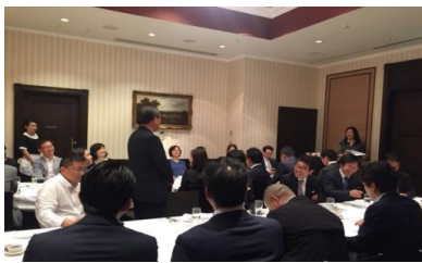
例会(会員交流会)の様子(赤坂)