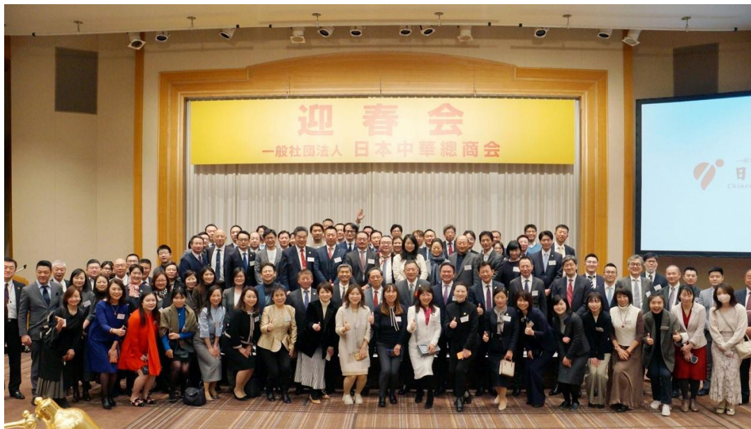
参加者で記念撮影