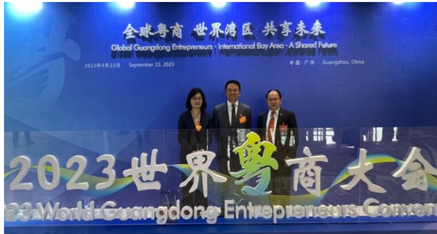
2023 世界粵商大会記念写真

この3日間を通してマカオ中華總商会や、広東省中山市と双方の発展に向けて連携強化することで一致しました。