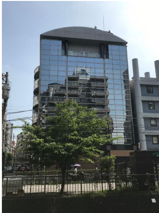
本会事務局の入居ビルの外観