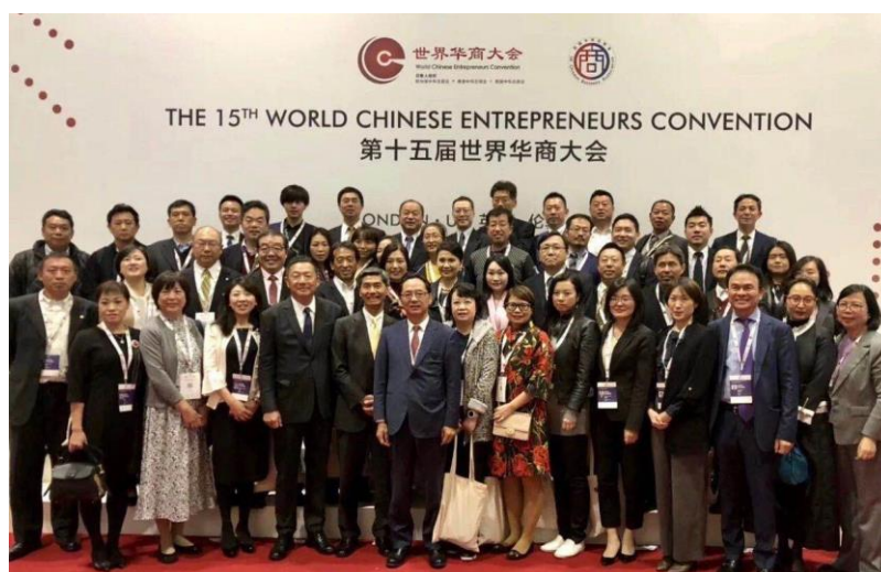
2019年ロンドン世界華商大会に参加した本会の代表団