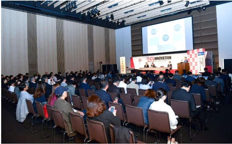
2018年東京で開催した華商経済フォーラムの様子