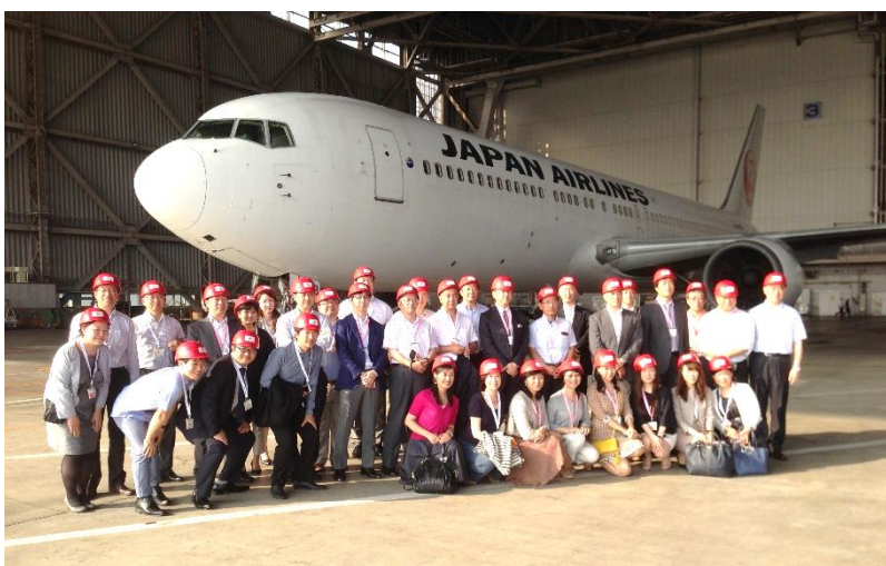
各業界のリーディングカンパニーへの視察活動