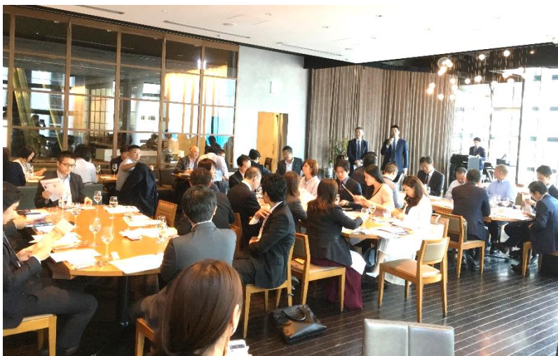
毎回、多くの参加者が集まる例会

会員企業の経営管理とコンプライアンス水準の向上、ビジネスネットワークとビジネスチャンスの拡大、会員間の交流と協力に役立つことを目的として、本会は、会員同士の交流や新入会員の紹介も兼ねる例会（会員交流会）、専門家を招いて講義をして頂くセミナー、会員の視野を広め、成功企業の秘訣を探る目的で、各業界のリーディングカンパニーを視察するなど、さまざまな活動を展開しています。